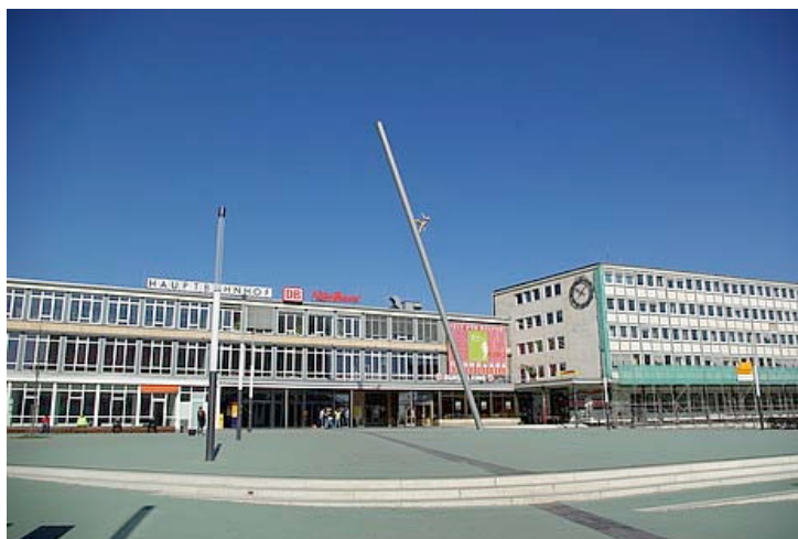
Kassel, Central Station (Culture Station)